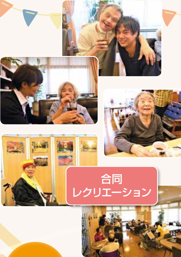
合同 レクリエーション